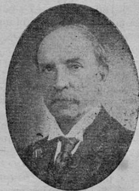
Lic. don Ricardo Jiménez Oreamuno Modelo de patriotas, prócer insigne campeón de la Legalidad y la Justicia

fueron nombrados por aclamación los tres señores Diputados postulados por el Lic. don Ricardo Jiménez Oreamuno; que una vez más triunfó la tesis sostenida y apoyada por este ilustre hombre público de fenomenal clarividencia y recto criterio, fiel observador del espíritu de las leyes escritas, y amante de los principios de Libertad, Igualdad y Fraternidad, hermosa trilogía sobre la que están sentadas las bases de las verdaderas repúblicas.